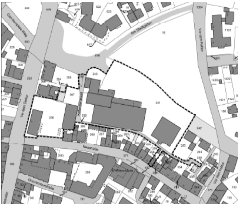
--- Grenzen des Geltungsbereiches der Aufstellung des Bebauungsplanes R 8 A für die Umsetzung des Stadtquartiers „Stadtgarten-Quartier am Delltor“ der Stadt Rees

Der Geltungsbereich des Bebauungsplanes R 8 A „Stadtgarten-Quartier am Delltor“ ist aus nachstehender Skizze ersichtlich: