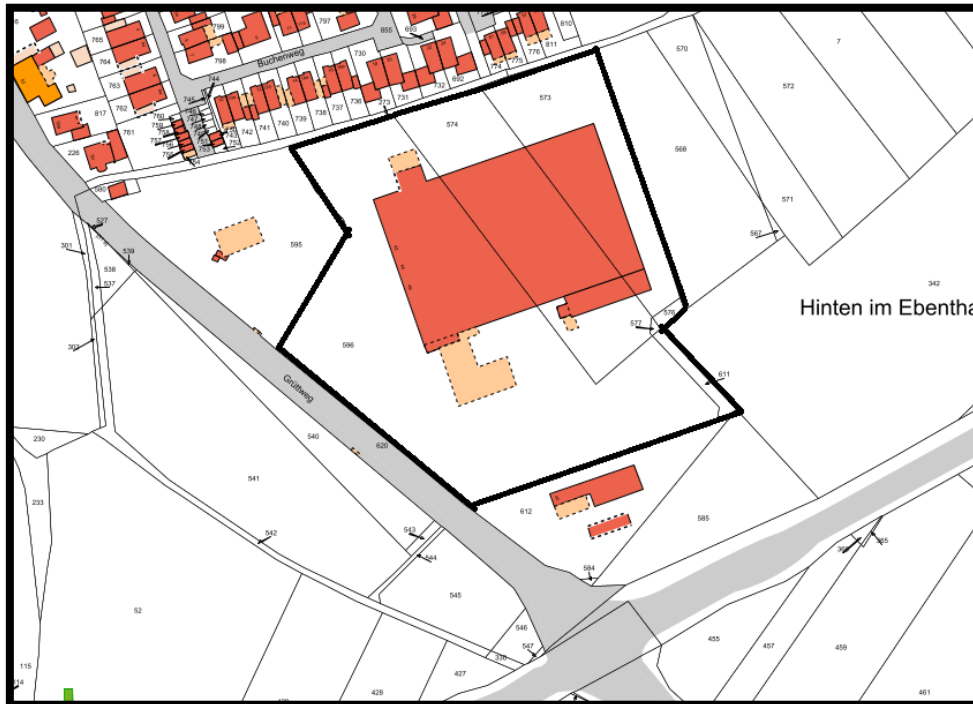
Grenzen des Geltungsbereiches der 6. Änderung des Bebauungsplanes R 16 „Gewerbegebiet Grüttweg/B67“

Gemäß § 3 Abs. 2 i. V. m. § 4 Abs. 2 BauGB liegt der Entwurf der 6. Änderung des Bebauungsplanes R 16 „Gewerbegebiet Grüttweg/B67“ der Stadt Rees mit Begründung, Artenschutzrechtlichem Fachbeitrag und Umweltbericht in der Zeit